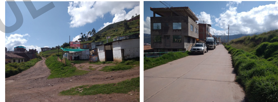
VIAS CON RIESGO DE INSEGURIDAD - FALTA DE ILUMINACIÓN